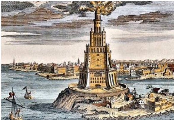
Reconstitution du phare

Il s'agit aussi du dernier monument construit dans la liste des 7 merveilles du monde.