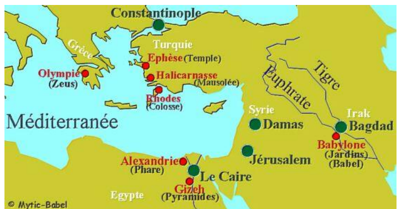
Carte des 7 merveilles du monde

Le phare d'Alexandrie se situait en Egypte sur l'île de Pharos (qui a donné le mot « phare »), située face à la ville d'Alexandrie. Le phare, bâti sur l'île, fut commencé sous Ptolémée I et terminé vers 280 av. J.-C sous le règne de Ptolémée II. La construction du phare est attribuée à Sôstratos de Cnide, dont une dédicace était présente sur une statue du phare. Cependant, la paternité de ce monument n'a pas été confirmée.