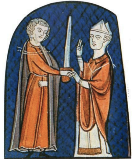
Le sacre du roi de France (Ordre de la consécration et du couronnement des rois de France, manuscrit, 1280).